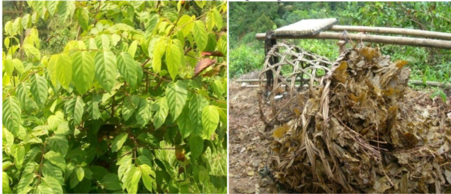
Gambar 1 Tanaman gambir dan ketapang

kg/ha/th dan 32 ran kolincuang 2400 liter. Baik ampas ketapang maupun kolincuang diyakini mengandung unsur hara baik mikro maupun makro serta bahan organik yang dibutuhkan oleh tanah dan tanaman mengingat kandungan yang ada pada gambir itu sendiri (Gambar 1)