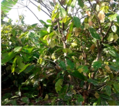
Gambar 5. Kakao ( Theobroma cacao )

1 sedang tanaman sela yang dijumpai adalah pinang ( Areca catechu L), lengkuas ( Alpinia galanga ), jahe ( Zingiber officinale ), temulawak ( Curcuma xanthorrhiza ),