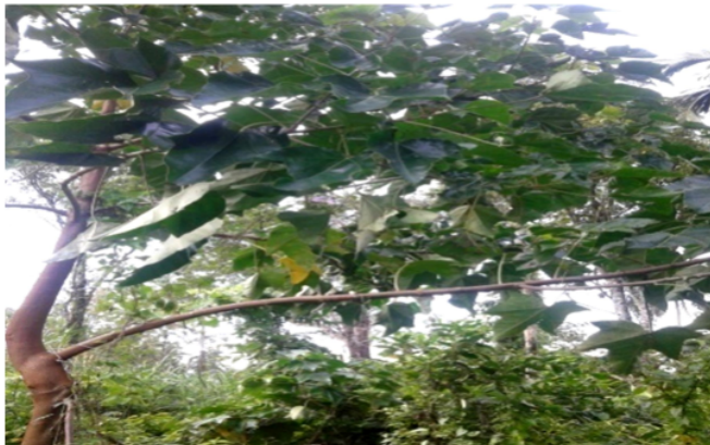
Gambar 3.damar ( Agathis dammara )

Tumbuhan pohon-pohonan yang mendominasi ladang masyarakat di kawasan subDAS ini adalah damar ( Agathis dammara ), kayu kulit manis ( Cinnamomum verum ), surian ( Toona sureni )