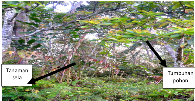
1 Gambar.2 Sistem pengolahan lahan secara konservasi, yaitu Wanatani dengan jenis pertanaman sela.

Tumbuhan pohon-pohonan yang mendominasi ladang masyarakat di kawasan subDAS ini adalah damar ( Agathis dammara ), kayu kulit manis ( Cinnamomum verum ), surian ( Toona sureni )