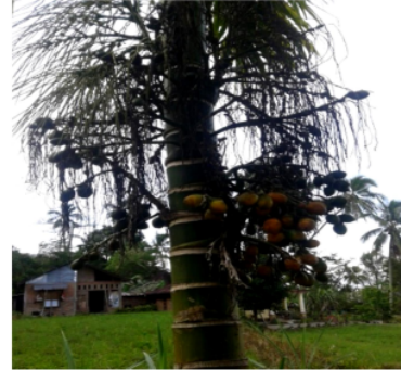
Gambar 6. Pinang ( Areca catechu L)

1 kakao ( Theobroma cacao ), pepaya ( Carica papaya ), jeruk ( Citrus x sinensis ) dan pisang ( Musa acuminata , M. balbisiana , M. Paradisiaca )