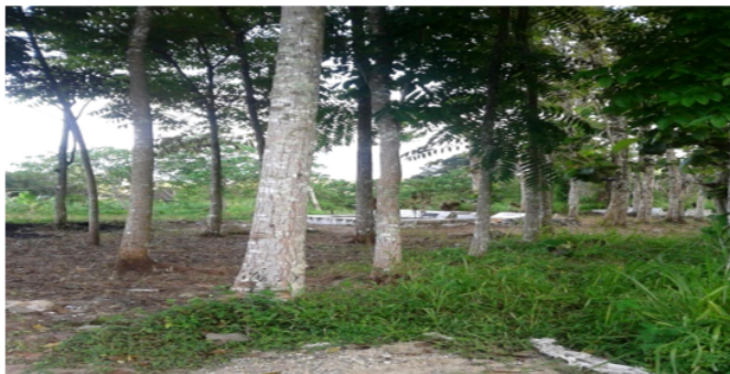
Gambar 4. kulit manis( Cinnamomum verum )