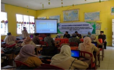
Gambar 1 Penyampaian Materi

pada pelatihan ini peserta juga dibeli dengan seluk beluk metode pembelajaran inovatif.