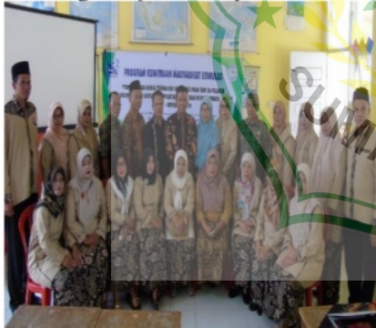
Gambar 2 Foto Bersama guru Mitra

Setelah kegiatan berakhir dilakukanlah penilaian angket untuk mendapatkan hasil seberapa pentingnya kegiatan ini dan implementasinya bagi guru-guru di SDN 26 Pulakek, Kab. Solok Selatan agar dapat nantinya dievaluasi